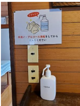
館内各所に消毒液設置しています。こまめに殺菌を！