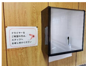
洗面書にペーパータオル導入しました。ドライヤー希望の方はスタッフにお声がけ下さい！