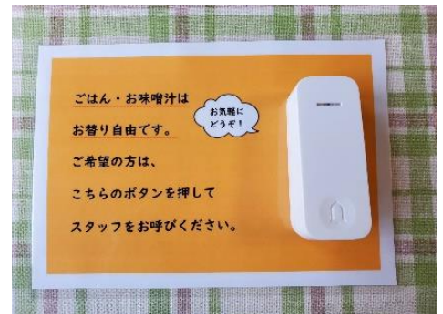
ごはん&お味噌汁&朝食の生卵、お替り継続中！