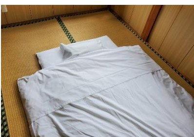
掛け布団に、襟カバー追加しました。安心してお休みください！