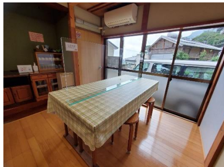
食堂テーブルにアクリルパーテーションを設置しました