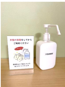
館内各所に消毒剤設置しています。 こまめに殺菌を！