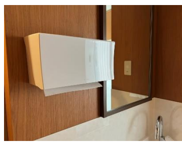
水回りには全てペーパータオルを設置しています