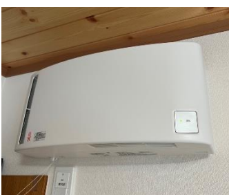
共用スペースに大型換気扇を設置！ 常時換気いたします