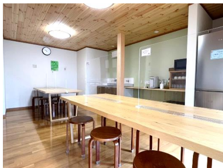
食堂テーブルにはアクリルパーテーションを設置しています