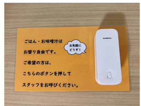
ごはん＆お味噌汁＆朝食の生卵、お替り継続中！